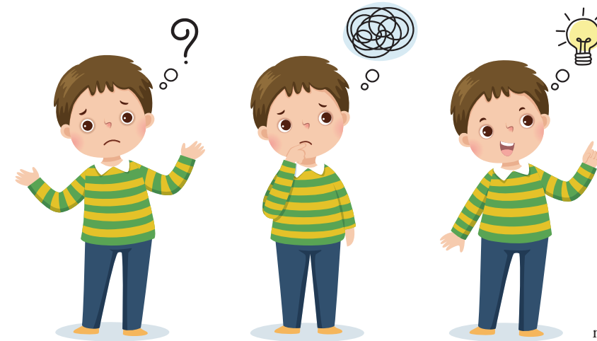
Zet Denken - Delen - Uitwisselen in om de voorkennis te activeren.

hebben op uitzonderingsgevallen en het liefst ook 'echt denken' uitlokken. Vragen die een logische conclusie oproepen (In welk seizoen kun je dit zien?) of analytische vragen (Welke fout wordt in deze som gemaakt?) verdienen daarbij de voorkeur.