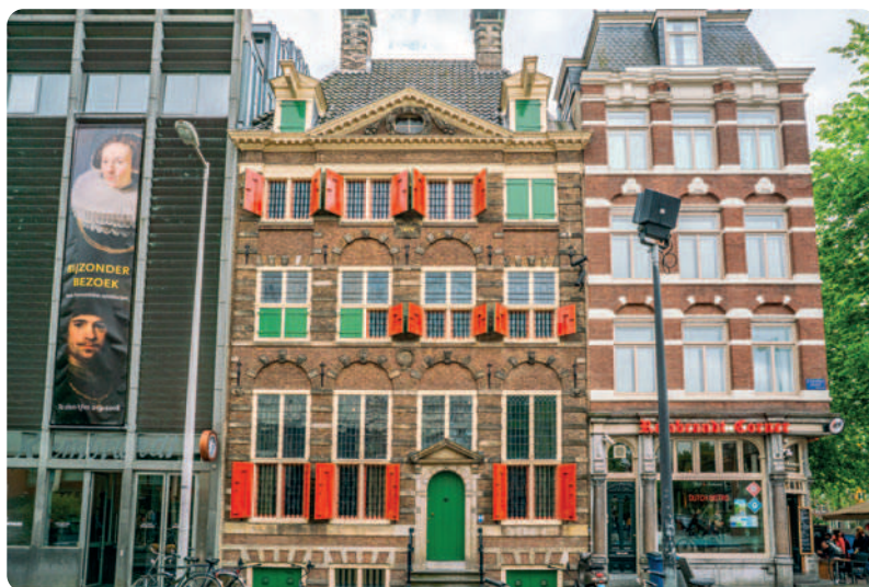
Het Rembrandthuis

TEKST THEO WILDEBOER